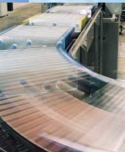
Onze volautomatische was- en drooginstallatie

Euromate BVBA T (03) 740.00.00 F (03) 744.26.42 E info@euromate.be I www.euromate.be